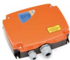
>>> Receptor R70MR11